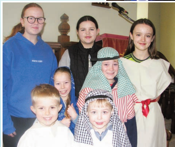
Gwasanaeth Diolchgarwch, Hydref 2023

yr ysgol Sul ddrama'r geni ar bawn Sul, 17 Rhagfyr, sef Cnoc, cnoc, cnoc , a chafwyd gwasanaeth ardderchog ganddynt. Rhwng y tair oedfa llwyddwyd i godi £181 o bunnau i Apêl Ffynhonnau Byw.